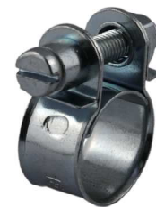
MINI sponky "French"